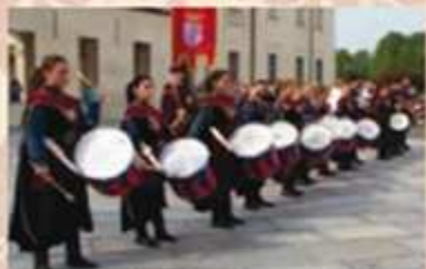
Sbandieratori e musicisti di San Damiano D'Asti

piazza del Comune Incontro con le Autorità Civili e Religiose e SS. Messa solenne con le rappresentanze dei Gruppi Storici