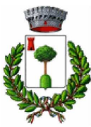
Comune di Pecco