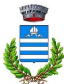
Comune di Andrate