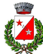
Comune di Settimo Vittone