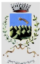
Comune di Rivara