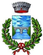
COMUNE DI PONT CANAVESE