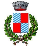
Comune di Borgiallo